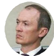
Вице-премьер РФ — руководителя аппарата Правительства Дмитрий Григоренко

Ранее из-за отсутствия финансирования школы и другие бюджетные учреждения могли «не соблюдать какие-то правила», а потом в рамках проверок надзорные государственные органы «наказывали самих себя, вынося штрафы» Это выглядело странно. Мы решили эту задачу, как обещали, у нас на сегодняшний день такие проверки запрещены, это все переведено в режим профилактики, которая запрещает штрафовать, но при этом дает рекомендации на предмет выявления нарушений и исправления, если такие есть