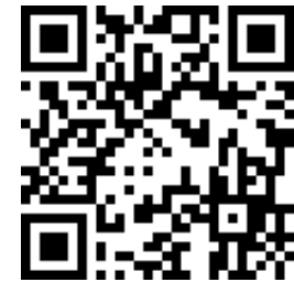
Единый календарь образовательных событий Минпросвещения России

Среди организаторов событий, размещенных в календаре, педагогические вузы Минпросвещения России, Московский государственный университет имени М.В. Ломоносова, АНО «АПГИ» и другие организации.