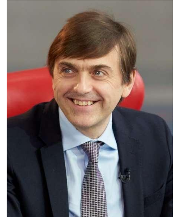
Министр просвещения РФ Сергей Кравцов

Следующее направление – современная инфраструктура, созданная в том числе в рамках национального проекта «Образование». Строятся и ремонтируются школы и детские сады, в также открыты 79 региональных центров, работающих по модели «Сириус», открыто более 250 центров «IT-куб», 365 технопарков-кванториумов, а также более 17 тысяч центров образования цифрового, естественнонаучного, технического, гуманитарного профиля «Точки роста».