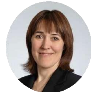
Замглавы Минобрнауки России Петрова О.В.

Реализуемая система федеральных инновационных площадок Минобрнауки России сегодня оказывает всестороннюю поддержку педагогическому сообществу – реализуемая инновационная площадка выступает организатором профессиональных конкурсов и мероприятий, разрабатывает педагогические учебники и пособия, оказывает информационную, правовую, методическую и информационную поддержку работникам образования и реализует и иные важные задачи в системе образования.