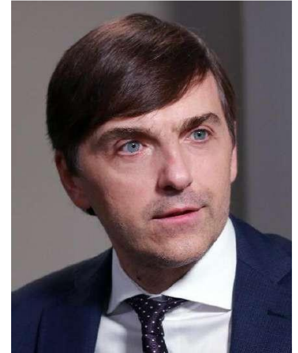
Министр просвещения РФ Сергей Кравцов